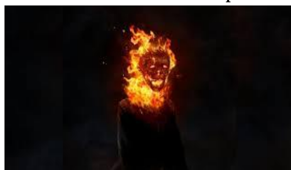
Gambar 13. Hantu Banaspati

Banaspati adalah hantu lokal di Jawa Tengah yang mungkin tidak begitu dikenal karena hanya ada di daerah tertentu. Namun, warga Jawa Tengah biasanya sudah akrab dengan keberadaannya. Banaspati berbentuk bola api yang menyala dan dapat menghisap darah manusia. Dalam cerita rakyat, Banaspati diyakini sebagai inkarnasi seorang pria yang mempelajari ilmu hitam tingkat tinggi. Ketika orang tersebut meninggal, dia kembali ke Banaspati. Hantu ini memiliki sifat negatif dan harus dihindari. Untuk bertahan hidup dari serangannya, orang-orang harus segera melarikan diri dan menyelam ke sungai. Keberadaan Banaspati menambah dimensi mistis dalam kepercayaan masyarakat Jawa Tengah sehingga menciptakan suasana yang menakutkan di sekitar wilayah tersebut (Samodra, 2024).