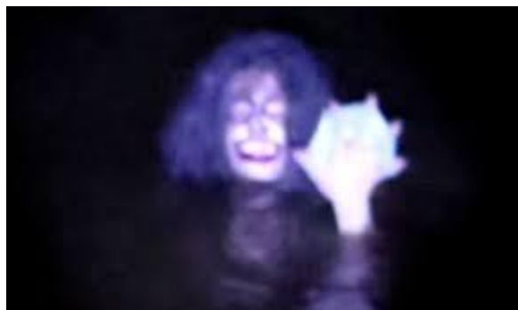
Gambar 14. Antu Banyu

punggung. Antu Banyu adalah legenda urban mengerikan yang menarik untuk diangkat ke layar lebar. Keberadaannya menambah aura mistis dalam kepercayaan masyarakat Sumatera Selatan.