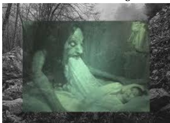
Gambar 9. Hantu Oreng Pote

Oreng Pote adalah makhluk halus yang sangat terkenal dan ditakuti di Pulau Bawean, Jawa Timur. Wujudnya berupa hantu berkulit putih seperti mayat dan menyerupai manusia. Penduduk setempat menghindarinya karena mereka percaya hal itu dapat membawa nasib buruk atau kemalangan. Bahkan, yang akan terkena musibah bukan hanya orang yang melihatnya saja, orang-orang di sekitarnya pun bisa ikut kena imbasnya, seperti terkena penyakit aneh, bisnis bangkrut, bahkan bisa meninggal dunia secara tiba-tiba. Untuk menghindari hal ini, orang melakukan ritual tertentu atau mengunci rumah mereka saat malam tiba. Kehadiran Oreng Pote menambah warna seram pada mitologi dan kepercayaan lokal di Pulau Bawean, menciptakan suasana yang lebih menyeramkan dari film horor.