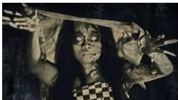
Gambar 8. Hantu Laek

Beberapa kepercayaan mengatakan bahwa ramuan khusus dapat mengubah Leak menjadi bentuk hewan.