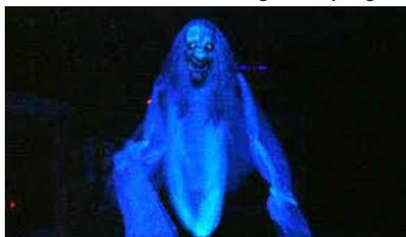
Gambar 12. Hantu Begu Ganjang

kepercayaan lokal di Sumatera Utara, menonjolkan betapa kaya dan beragamnya mitologi hantu di Indonesia (Samodra, 2024).