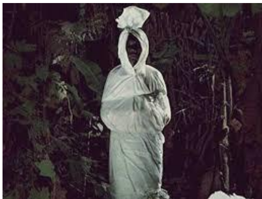
Gambar 2. Hantu Pocong

Pocong adalah hantu yang terkenal dan sering dikaitkan dengan kain kafan. Dipercayai bahwa pocong merupakan roh orang yang meninggal karena dimutilasi, namun kain kafan tersebut tidak dibuka setelah makam ditutup. Mereka berkeliling sambil menuntut agar kain kafan itu disingkirkan. Deskripsi mengenai wujud pocong bermacam-macam, ada yang berwajah datar tanpa mata, hidung, dan mulut, ada pula yang mengatakan mata dan hidungnya masih dipenuhi kapas atau wajahnya seperti terbakar (Muntaqo & El-Syam, 2021). Pocong dikenal sebagai hantu paling menakutkan di Indonesia bahkan pernah masuk dalam daftar hantu paling menakutkan di dunia (Murwonugroho, 2021).