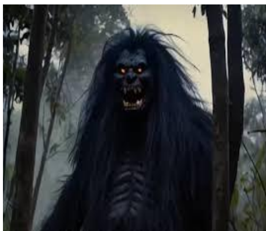
Gambar 5. Hantu Genderuwo

Terkadang genderuwo muncul dalam bentuk makhluk berbulu kecil yang dapat tumbuh dalam sekejap. Genderuwo juga suka melemparkan kerikil ke rumah-rumah penduduk pada malam hari. Salah satu hobi utama para jin adalah merayu wanita kesepian yang ditinggalkan suami atau jandanya, kadang-kadang jin tersebut bahkan melakukan hubungan seksual dengan mereka. Dipercayai bahwa benih genderuwo dapat menyebabkan seorang wanita hamil dan memiliki keturunan dari genderuwo (Suyono, 2009).