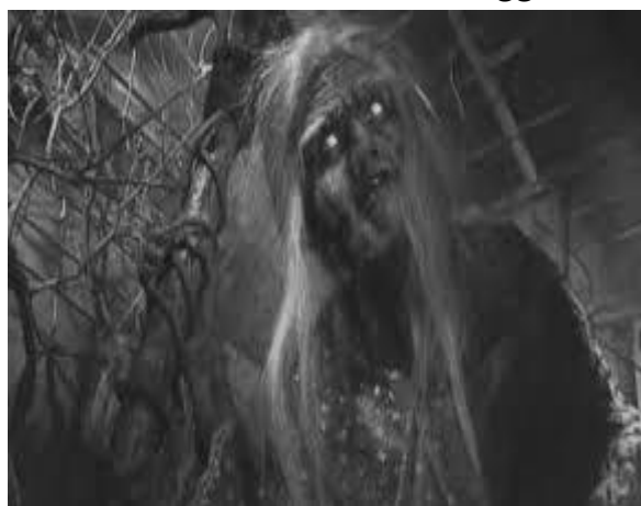
Gambar 11. Hantu Suanggi

Suanggi adalah hantu yang populer di Papua dan Maluku. Berdasarkan cerita setempat, suanggi merupakan perwujudan dari seorang dukun atau penyihir hitam tingkat lanjut. Konon, Suanggi bisa menjelma menjadi wanita cantik jelita yang gemar mengincar lelaki-lelaki jahat. Ia kemudian akan menyerang dan memakan organ vital orang tersebut. Suanggi biasanya muncul pada malam hari. Saat Suanggi datang, bentuknya menyerupai bola api yang terbang di atas rumah korban (Sari, 2021).