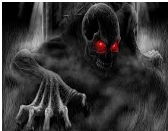
Gambar 10. Hantu Jerangkong

Kehadiran kerangka menambah kesan mistis pada mitologi lokal Indonesia dan menciptakan suasana tegang di sekitar area sepi tersebut (Sari, 2021).