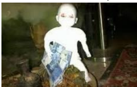
Gambar 6. Hantu Tuyul

menghasilkan uang atau kekuatan supranatural, sehingga menjadikannya makhluk yang menarik dalam cerita mistis Indonesia.