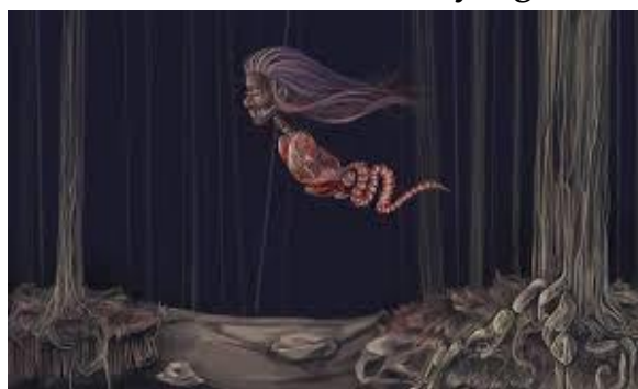
Gambar 7. Hantu Kuyang

Kuyang adalah hantu asli Indonesia yang berasal dari Kalimantan Timur dan telah menjadi topik hangat dalam budaya Indonesia. Hantu ini digambarkan sebagai seorang wanita berambut panjang tanpa tubuh, hanya memiliki kepala dan organ dalam. Warga sekitar mempercayai bahwa Kuyang merupakan sosok setan yang haus darah, terutama darah bayi dan ibu hamil. Menurut cerita rakyat, Kuyang sebenarnya adalah seorang laki-laki yang mencari ilmu hitam. Untuk mencapai tujuan mereka, mereka melepaskan wujud manusia mereka di malam hari dan kembali ke Kuyang. Semakin banyak darah yang diminum, semakin tinggi pula tingkat ilmu hitamnya. Keberadaan Kuyang menambah warna dan kedalaman cerita mistik Indonesia, memperkaya warisan budaya yang kaya akan legenda dan mitos (Samodra, 2024).